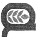
TABELLA PAGA OPERAI AGRICOLI E FLOROVIVAISTI A TEMPO DETERMINATO IN VIGORE DAL 1° ottobre 2024 - provincia di AVELLINO comprensiva dell'aumento rinnovo CPL del 07/11/2024